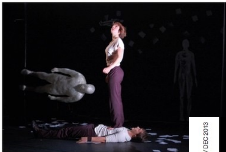
CIRCUSMAGAZINE / DEC 2013