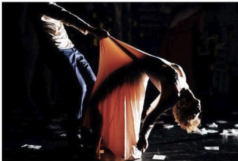
Wonders de la compagnie Side-Show

Cru et Wonders ne sont pas que du cirque. Les représentations flirtent avec les limites du genre, intégrant la beauté métaphorique de la danse contemporaine et soulignant l'expressionnisme d'un théâtre de l'absurde. Beckett les regarde. Pina Bausch les guette. Et le cirque prend un nouveau souffle artistique.